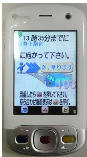
予約の入った乗降場へ