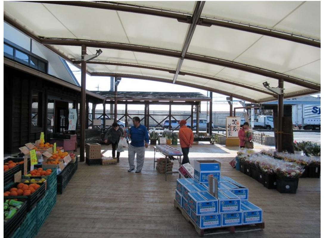
屋外販売スペース