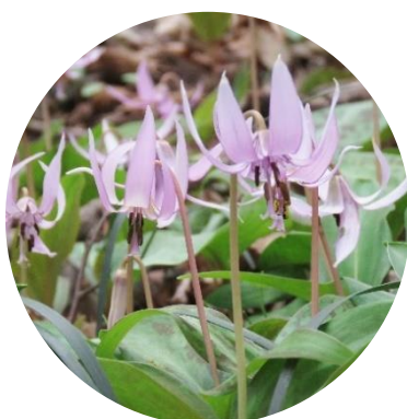
市の野草「カタクリ」