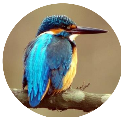
市の野鳥「カワセミ」